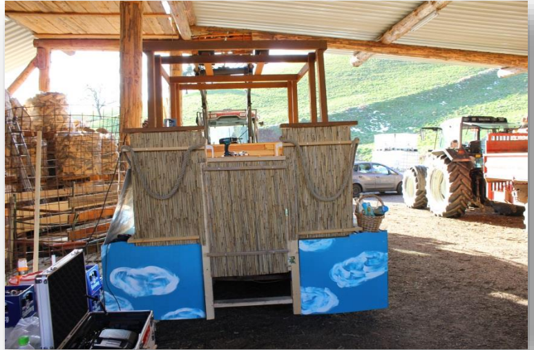
Beim Wagenbau auf dem Simeshof in der Frohnau.