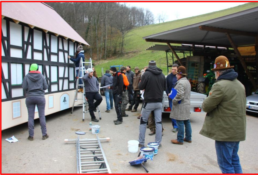
Letzte Arbeiten auf dem Deckerhof im hintere Einbach.