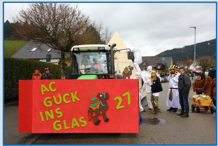
Die Gruppe beim Wagenbau im Neuenbach.