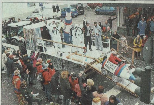
Die Kleinsten der Gruppe TTKG nahmen im »Groko-Becken« Platz (linkes Bild). Unter dem Motto »Viel Rauch um Niggs« machten »TKKG« mit ihren Jamaika-Bobs die Straßen unsicher (rechtes, oberes Bild). Die »Powenz-Bande«, die als Astronauten verkleidet war, hatte auf ihrem Gefährt eine mobile Rakete dabei, in der Zuschauer in galaktische Gefilde geschossen wurden.