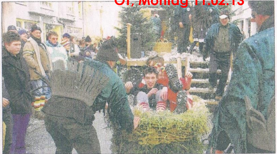
Gefedert: Die (P)Auerhühner der Powenzbande kamen als Auerhühner, denen nun wegen der Windräder der Flugweg versperrt ist. Sie machten mit ihrem Federwagen auch das Publikum zu Auerhühnchen.