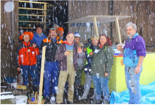
Die ganze Gruppe bei heftigem Schneefall auf dem Schulerhof in hinteren Neuenbach.