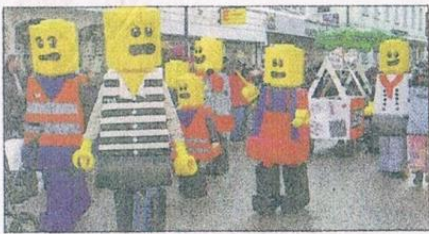
Ganz schön steif: die Legomännle aus der Frohnau