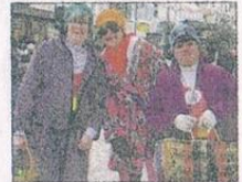
Die Nixen vom Badepark: die Hermann-Schmider-Gruppe.

Ein Video zu diesem Thema ab Montag, 18 Uhr unter: www.mibv.de Videocode: 12345