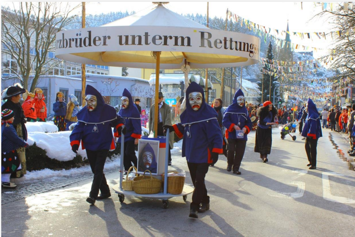
Erzbrüder unterm Rettungsschirm

die Herre hemmer schee o´geschmiert, unser Silber isch in die Schweiz deponiert.