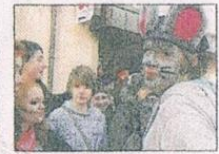
Flirt mit dem Publikum: Eine Maus von »AC Guck ins Glas«.