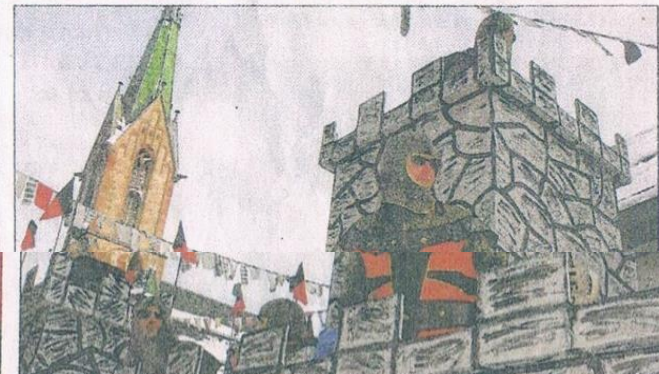
»Und nimmt die Narretei mal überhand, so schütze mer Burg und Badnerland«, gaben die Ritter von »TKKG« kund, die seit 13 Jahren ihren Wagen auf dem Schochenhof bauen.