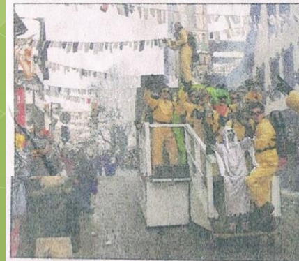
Als Geisterjäger »Ghostbusters« kamen Hausachs »Ultras« mit riesigem Spektakel, vollem Sound und Feuerwerk.