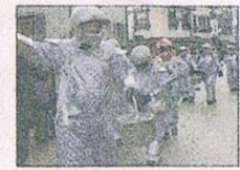
»Die Gutacher hân au e Sparre: Jetzt welle so uf de Mond, die Narre!