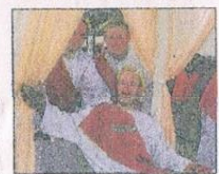
Beim Zeus: Die Einbacher »Funky Monkeys« feierten ihren »zehnjährigen Wagenbau«.