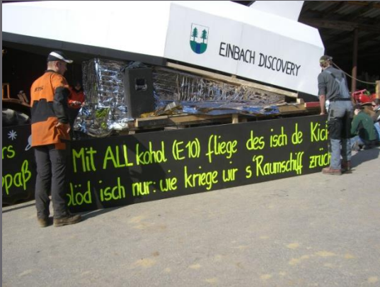
Die Gruppe beim Bau auf dem Deckerhof im hinteren Einbach.