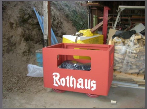
Beim Wagenbau, Simeshof, in der Frohnau