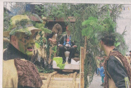
Die Funky Monkeys machten sich als Waldmenschen ebenfalls über das »Schlisslisle« auf dem Schlossberg lustig.

Und natürlich kündigten vorneweg die Narrenzunft selbst mit der Katzenmusik und den Hästrägern, den Burgfrauen und den Narrenräten das großartige Schauspiel an. Auch die weiteren Hausacher Zülfte mischten sich unters Umzugsvolk, das tausende Zuschauer erfreute.