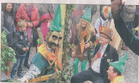
Hausachs EAV steuert zu den Burgfestspielen eine Zapfenschleuder bei – und gewinnt den »Burgis« als Mitspieler.