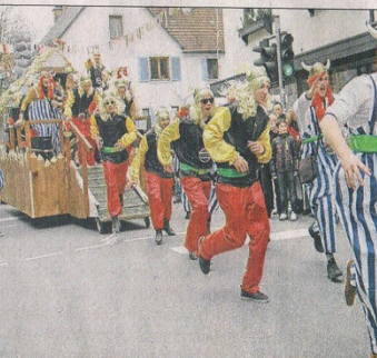
Bei ihrem ersten Auftritt stürmen die »Ultras« als Gallier (von links) die Hausacher Hauptstraße. Beim Tanz der Vampire des »AC Guck ins Glas« geht's für die Opfer erstmal in den Sarg, dann im Kreis und schließlich per Rutsche zurück ins Leben. Bis aus Rohr bei Stuttgart sind diese Waldhexen angereist, um ihre Pyramide in Hausach zu zeigen.