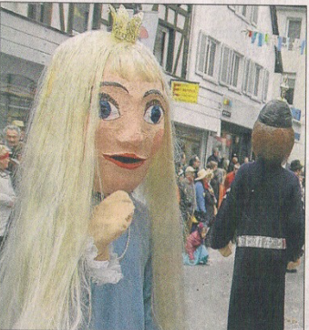
Die »Hauserbacher« zeigen ein »Kasperle-Theater«.