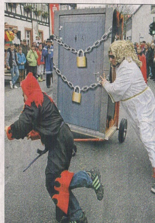
...und dann geht's mit Getränk in der Hand rund.