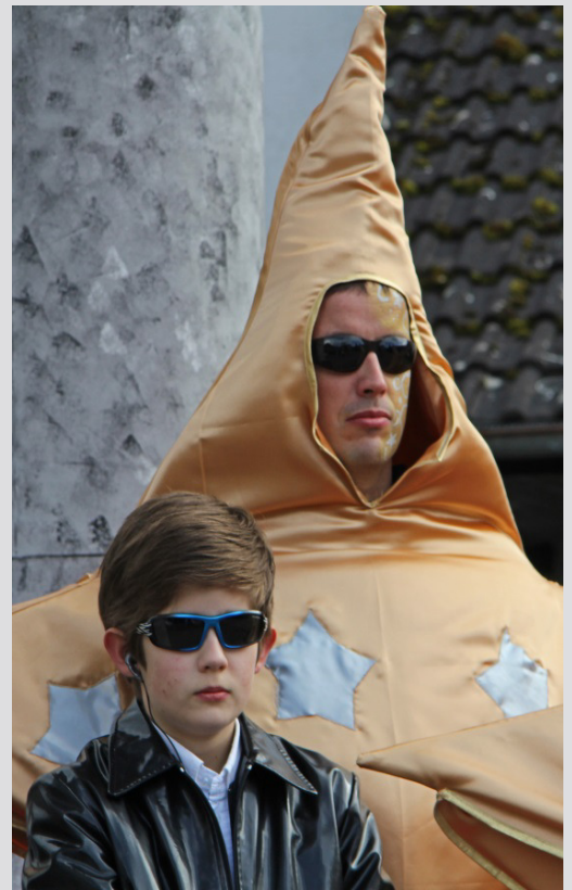
Jeder Star hat natürlich auch seinen privaten Bodyguard....