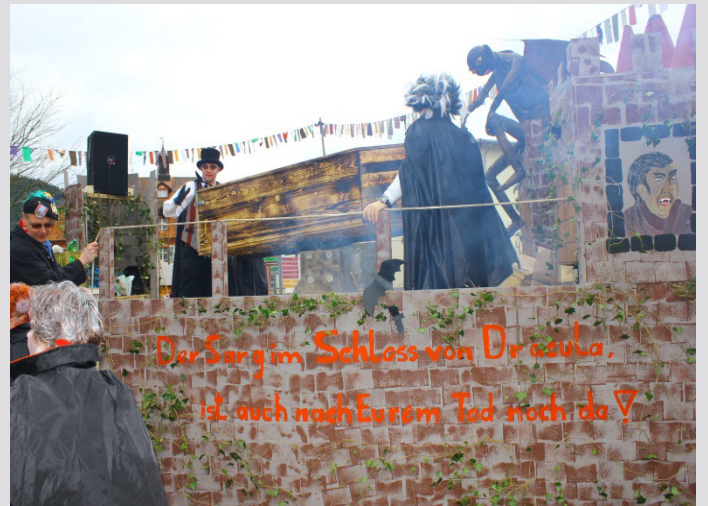
Die Gruppe beim Wagenbau im Neuenbach.