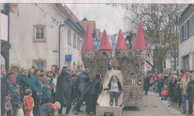
»AC Guck ins Glas« bringt den »Tanz der Vampire« auf die Hausacher Burgbühne.