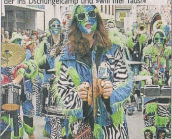
Ein Hit bei jedem Schritt: Aus der Schweiz sind die Meilemer Soihunds-Cheibe angereist ...