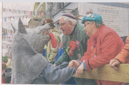
Die Hauserbacher machen den Burgfestspielen mit ihrem Kasperletheater Konkurrenz – doch was sucht der böse Wolf beim Pfarrer?

Die »Ultras« führen bei den Hausacher Burgfestspielen zum Fasentumzug »Asterix und die Gallier« auf und machen immer wieder Jagd auf ihren Römer. Linke Bilderreihe von oben: Die Gutacher Frauen spähen als Freiheitsstatuen die Hausacher Burgfestspiele aus, TKKG ist mit »Stars und Sternchen« dabei. Die »Kleinen Strolche« und die A-Jugend 89 (rechts Reihe, von oben) nehmen das Festspiel-WC auf der Burg auf die Schippe. Die Powenz-Bande treibt als Folterknechte ihr Unwesen auf der Burg, und Bauer Mimi hat seine Liebe Not mit den Hühnern von der »Nozzehöhll«.