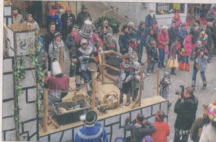
Die Dewis-Bagasch verwandelt die Burgfestspiele in Ritterspiele.

Eine Bildergalerie zu diesem Thema finden Sie unter: www.bo.de | Webcode: 1D95D