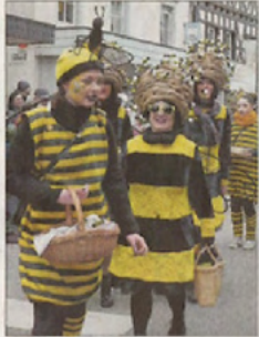
Die Frohnauer Bienen.