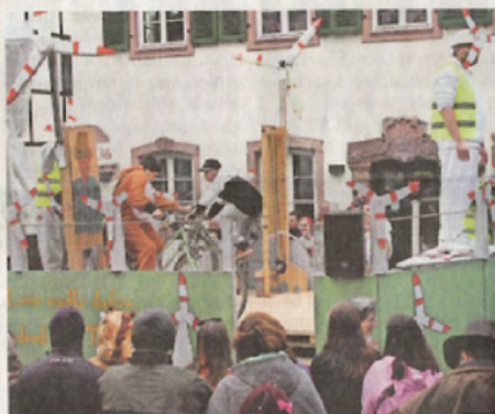
Windradbau – für „AC Guck ins Glas“ kein Problem.

Eine der ältesten Gruppen waren die Hauserbacher, die mit ihrem diesjährigen Hamsterrad bereits zum 46. Mal an einem Umzug teilnahmen. Bereits 38-Mal haben sich die Hausachs „EAV“ und „Die kleinen Strolche“ am Umzug beteiligt.