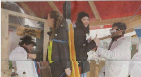
estschnallen - und ab geht's: Mit dem Fahrrad wird der lebendig bestückte Schrauber bedient.