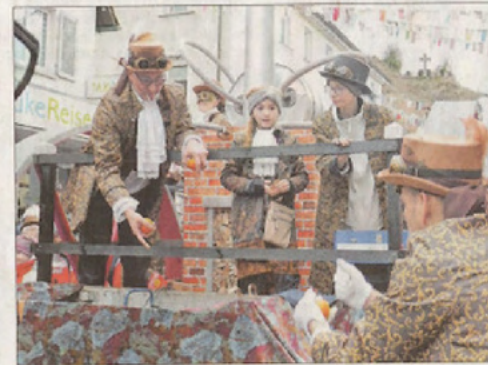
Die Kleinen Strolche mit ihrem Steampunk.