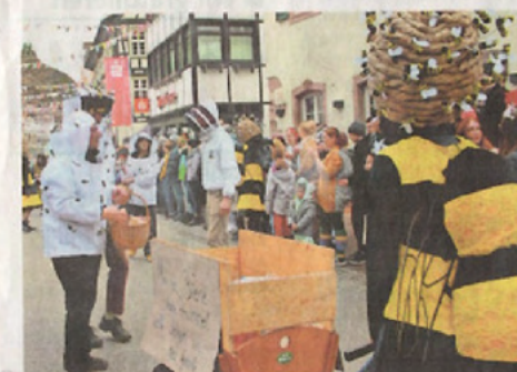
„Bienen und Imker“ flogen aus der Frohnau ein.