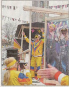
Der EAV mit seinen Gymnastik-Einlagen der 1970er.