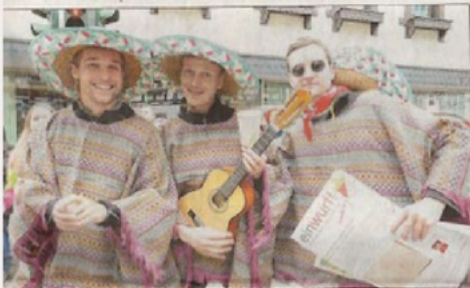
ausachs Ultras geben als Mexikaner sogar ein eigenes Narrenrätts raus.