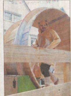
Die Hamster der Dewis-Bagasch.