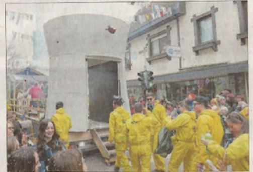
Die Einbacher Joker bauten ihr eigenes AKW.

Eine Bildergalerie gibt es auf www.bo.de unter Code 71619