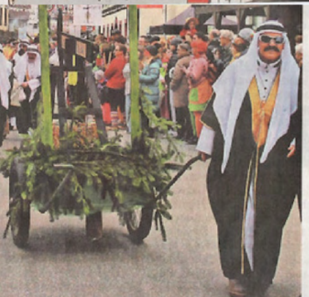
Ein Atomkraftwerk präsentierten die „Einbacher Joker“.