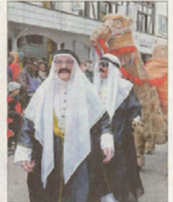
Als Ölscheichs nehmen die „Gutacher Frauen“ nach 30 Jahren Abschied vom Hausacher Umzug.