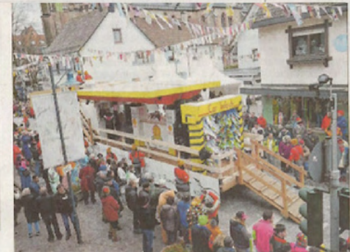
Der Hausacher Wüfel Hufe „betankt“ das Publikum mit allerlei Sprit.