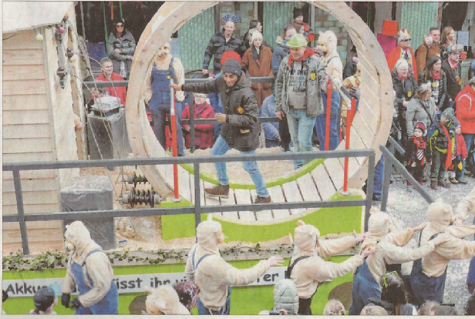
Die Hamster der TKKG tanzen Polonaise, „Ausgewählte“ aus dem Publikum schuftten im Hamsterrad.