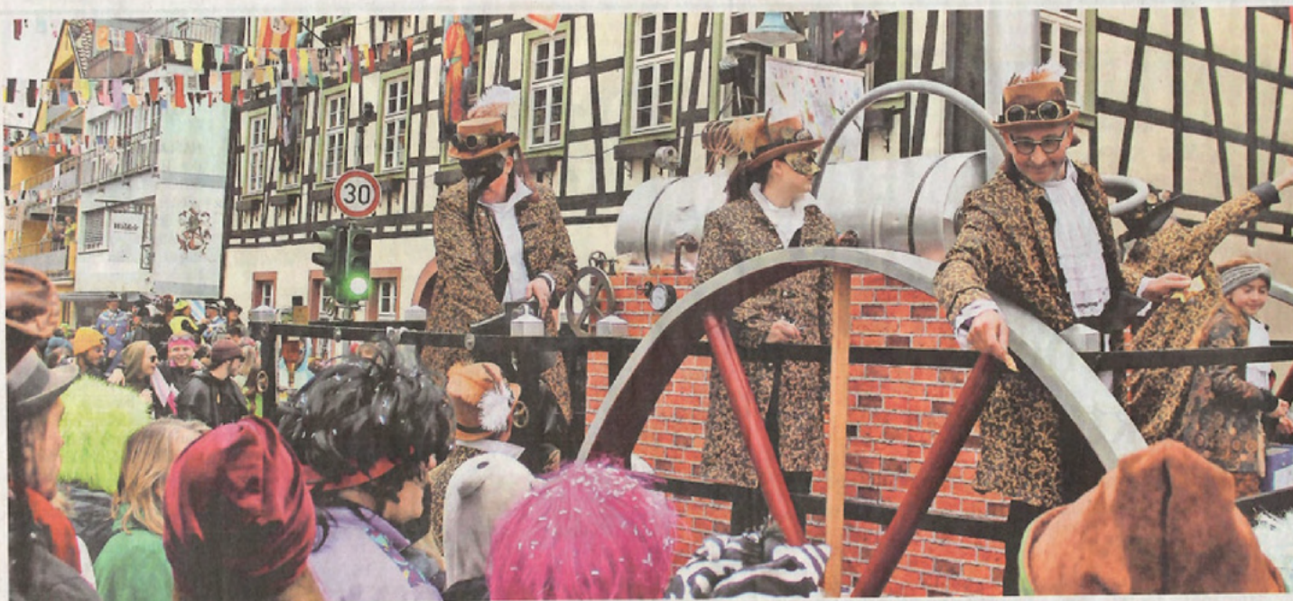
„Die kleinen Strolche“ waren zum 38. Mal beim Hausacher Umzug dabei.