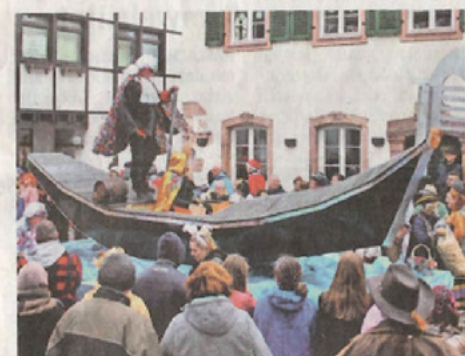
„Noggehöll“ mit einer venezianischen Gondel

Der Fastnachts-Umzug in Hausach hat am Sonntag die Massen mobilisiert. Ungezählte Zuschauer säumten die Hauptstraße.