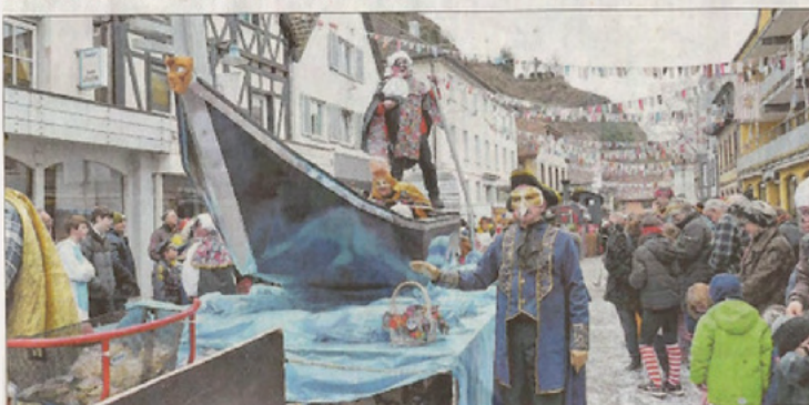
Die Venezianer von der Noggehöl brauchen für ihre Gondel weder Strom noch Gas.