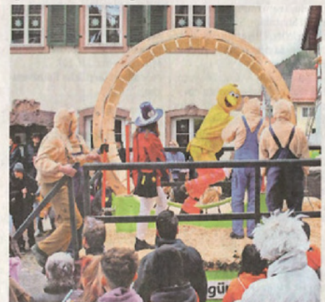
Das Hauserbacher Hamsterrad