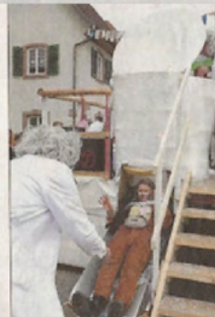
Die Powenzbande jagte „Jeden Scheiß“ durch ihre Biogasanlage.