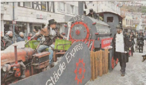
Die TKKG fuhr mit Volldampf in die Vergangenheit.