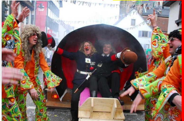
Nach der einer Fahrt im Riesen Joint waren alle etwas benebelt.