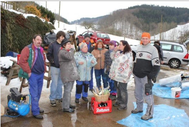
Aufwärmen beim Wagenbau. Viele hatten mit den kalten Temperaturen in diesem Jahr zu kämpfen.